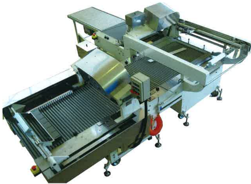
TXA-7(自動タイプ) Automatic Type