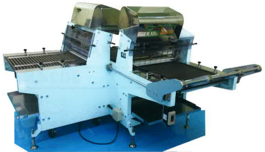
TX-7(手動タイプ) Manual Type